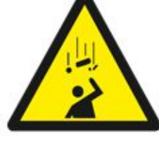
احترس من المواد المتساقطة Warning Falling objects