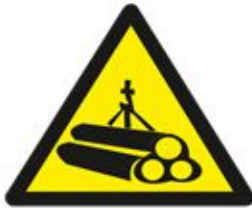
تحميل المواسير Loading Pipes