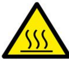
خطر حرارة عالية High Temperature