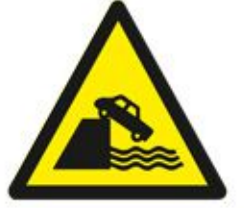
Danger End of Quay خطر نهاية الرصيف البحري