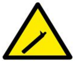
خطر غاز طبيعي Natural Gas