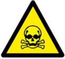
Warning Dangerous Chemicals انتبه مواد خطيرة