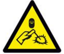
WELDING خطر منطقة لحام