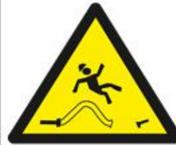
خرطوم ضغط عالي HIGH PRESSURE HOSE