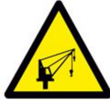
Caution Offshore Crane خطر منطقة عمل ونش