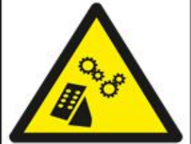
المعدة تعمل أوتوماتيكيا Remote Operated Machinery