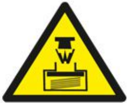
ضغط عالي HIGH PRESSURE