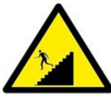
احترس عند استخدام السلالم Caution when using stairs