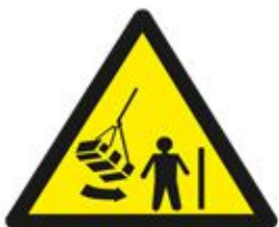
طرق تحريك الطرود Moving Rotating Load