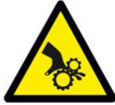
Caution Machinery / Pinch Point احذر نقطة تشغيل ماكينة