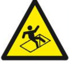
Caution Open Manhole احذر غطاء مفتوح