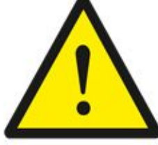
علامة تحذير عامة (يمكن إضافة أي نص للتحذير) General Warning Sign (you can write any warning)